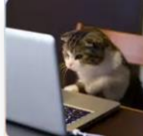
3) Listo/a para aprender